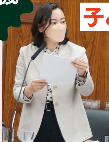
5月29日 資源エネルギー・持続可能社会調査会

5月15日資源エネルギー・持続可能社会調査会で、「次期エネルギー基本計画を議論する有識者会議に若者を入れてください」オンライン署名がとりまくられていることや、「僕たちの意見をもっと聞いて」など日本の子どもたちの声を紹介し、エネルギー基本計画などの政策プロセスに若者の参画、意見反映を求めました。