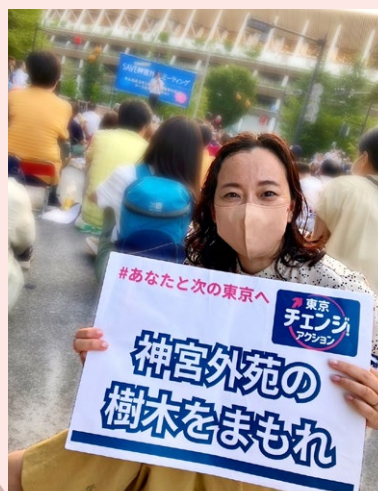
6月29日「SAVE 神宮外苑ミーティング」