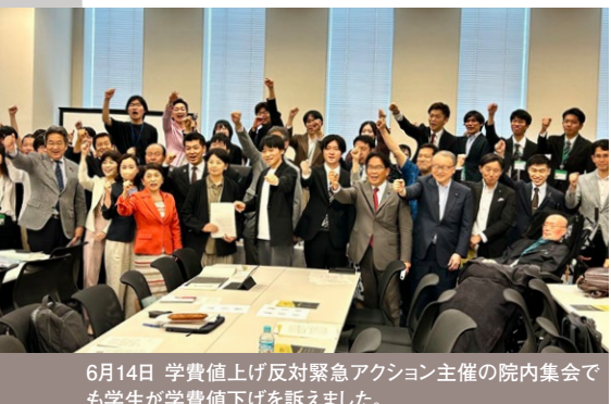
6月14日 学費値上げ反対緊急アクション主催の院内集いで、も学生が学費値下げを訴えました。

憲法26条 = 教育の機会均等の実現へ。 学費の値下げ、無償化へ力を合わせます。