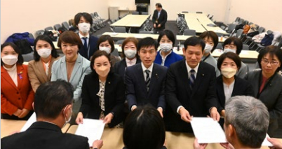
1月11日 被害を訴えづらい受験生を狙う痴漢の対策を求める