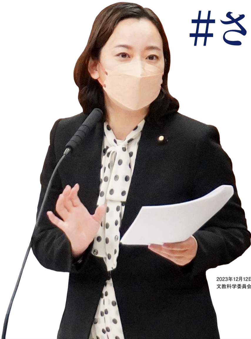
2023年12月12日 文教科学委員会