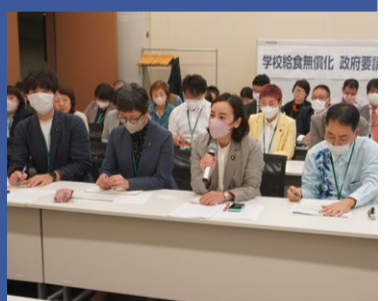
↑10月24日 学校給食無償化を求め文科省要請

「学校給食の無償化」や「学費の無償化」を求める声広がる中、街頭宣伝や文科省要請など、教育無償化を求める行動をつづけています。