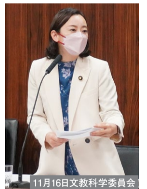
11月16日文教科学委員会

大学の自治を壊す改革を上から押しつけ、政財界のいいなりに軍事研究もいとわないような「稼げる大学」づくりを強力に進める法案。しかも、法案作成過程の議論の過程を記した公文書が「ない」と文科省。これを強行すること自体が民主主義の破壊です。