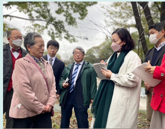
11月15日 多摩市に統一協会が取得した土地を住民のみなさんと視察

多摩市に、統一協会が国内最大の土地を取得したことが発覚し、住民に不安が広がっています。11月15日に、大学や都立高が隣接する現地を視察し、施設建設を完全に白紙撤回したうえで、被害者救済を進めてほしいという住民の声をききました。11月30日の文教科学委員会で、現地の声を届け、統一協会による被害救済のため、全面的な財産保全こそ必要と文科大臣に迫りました。