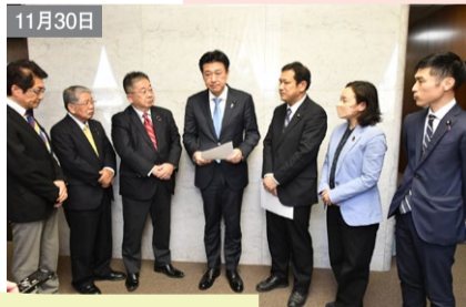
11月30日 米軍オスプレイ墜落に抗議。防衛大臣、外務大臣に運用停止など緊急申し入れ