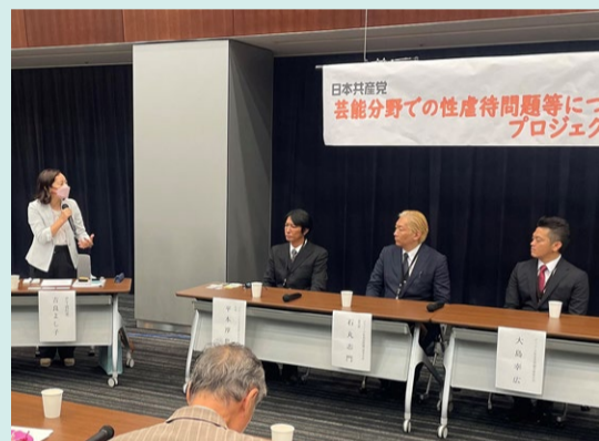
9月12日 党PTとして「ジャニーズ性加害問題当事者の会」からヒアリング

ジャニーズ性加害問題を受け、日本共産党議員団として立ち上げた「芸能分野の性虐待問題等に関するPT」の責任者として、「ジャニーズ性加害問題当事者の会」など関係者のヒアリングをつづけ、11月10日に被害者救済、再発防止のための日本共産党の「提案」を政府に届けました。11月16日に文教科学委員会で全容解明とすべての被害者救済を国の責任で行うことを求めました。