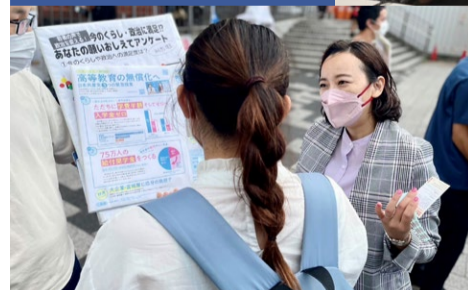
←10月7日 浦和駅で民青同盟のみなさんと学費無償化対話