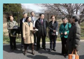
市民いこいの公園をつぶして 延焼遮断を名目にした道路を つくるのはおかしい！ 現地・赤羽自然観察公園を視察