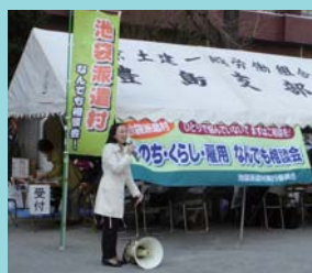
街頭でのなんでも相談会 池袋派遣村に参加、「一人で悩まず相談を」と呼びかけ

東京の上空を飛ぶ 新たな飛行経路による増便やめよ！ 羽田空港機能強化問題で 住民とともに国交省と交渉